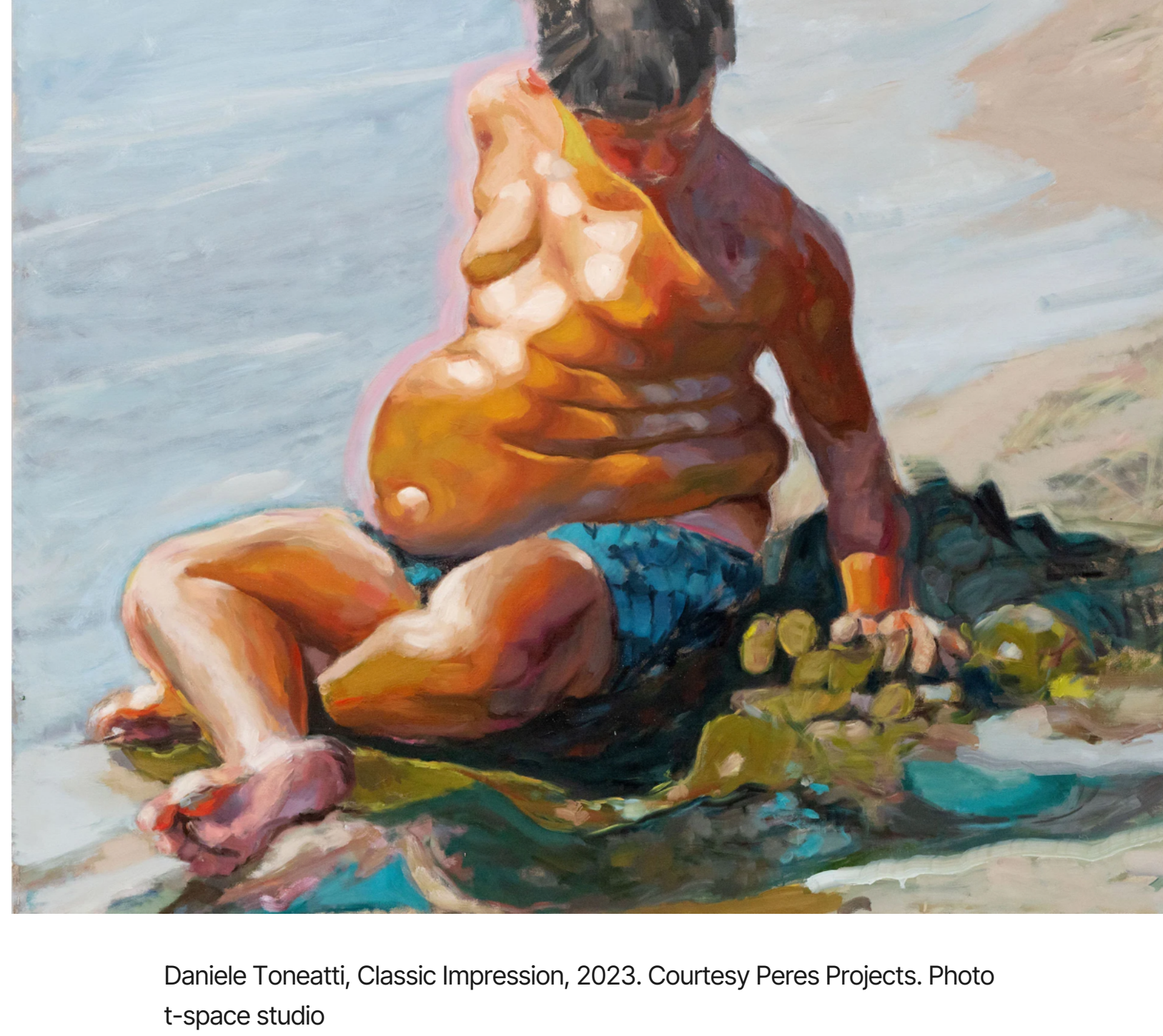
Daniele Toneatti, Classic Impression, 2023.

raro ritrovarlo in una galleria. L'effetto cattura subito l'attenzione, invitando a fare conoscenza con l'autore attraverso le sue opere. Un autore giovanissimo: poco più di trent'anni, veneziano d'origine. È questo Daniele Toneatti (1989), alla sua prima mostra italiana a lui dedicata.