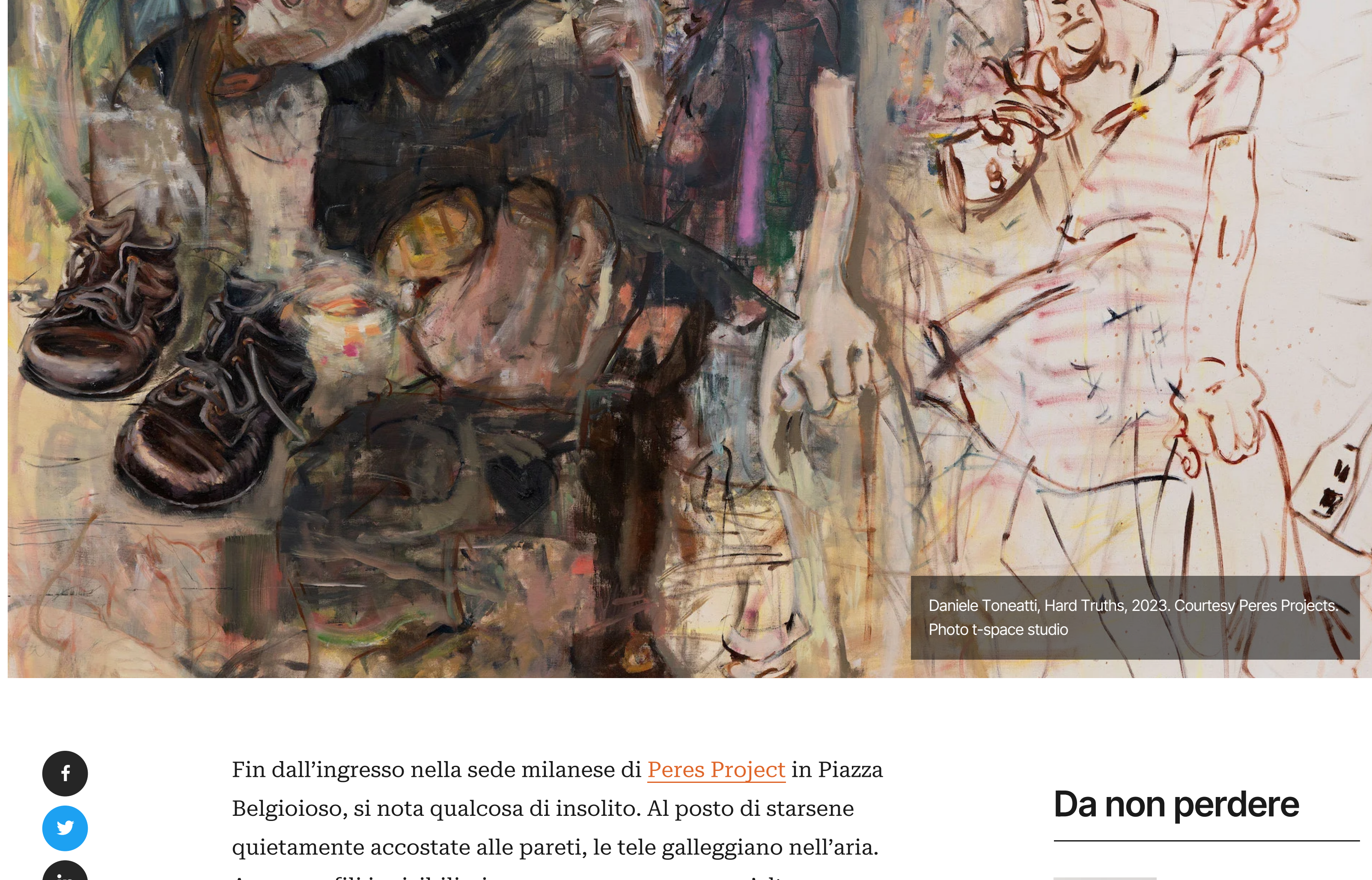
Daniele Toneatti, Hard Truths, 2023.